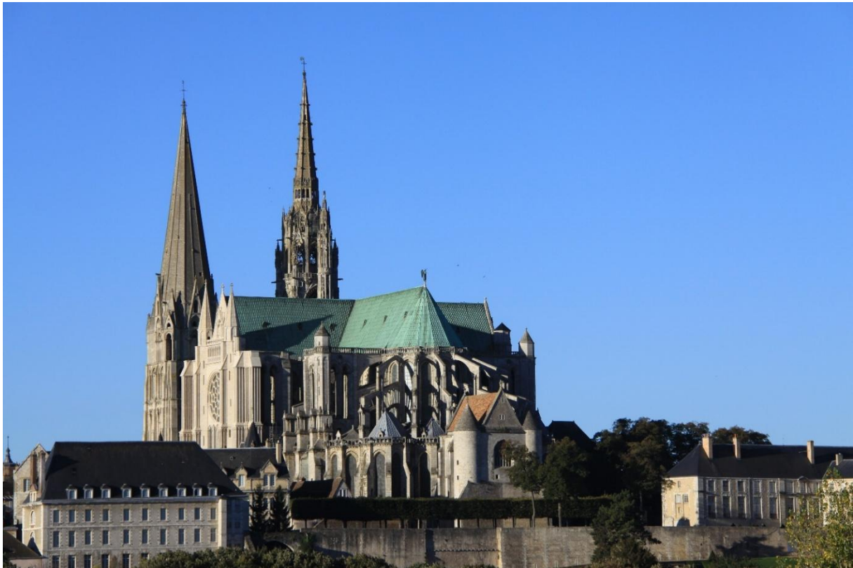
De kathedraal van Chartres vanuit het zuidoosten

Cursus in Chartres van 29 september t/m 03 oktober 2025 met optioneel een bezoek aan de kathedraal van Laon op 04 en 05 oktober